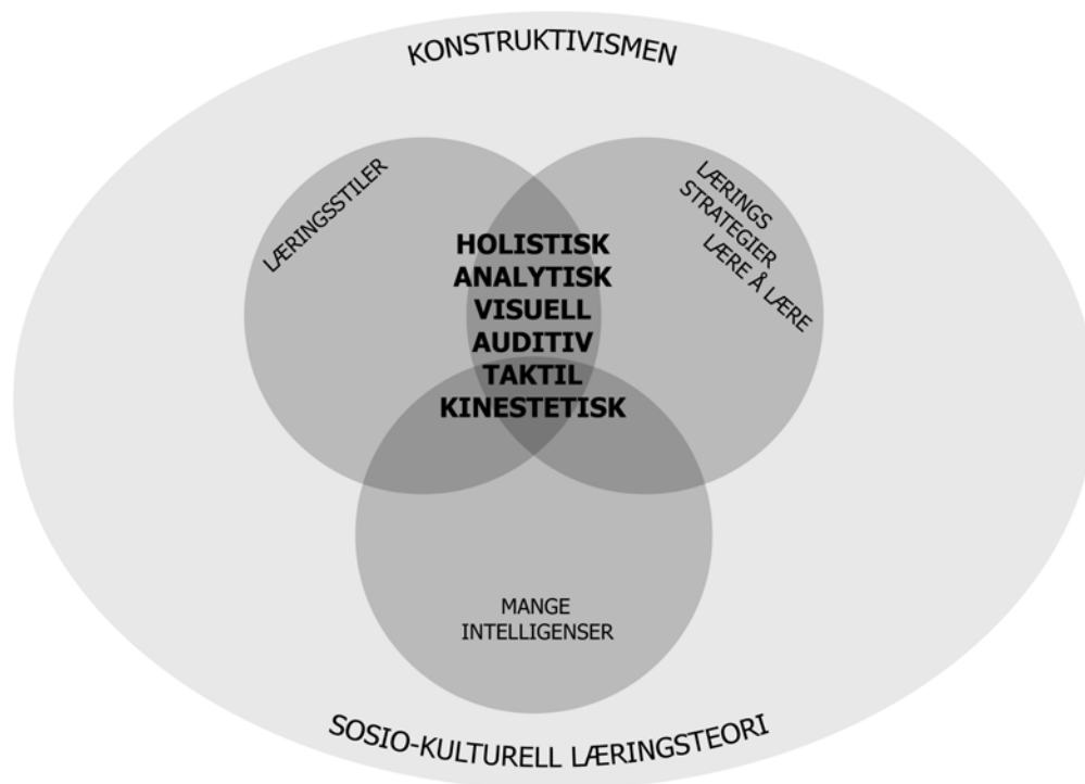
Figur 2 (tsl): Teorioversikt. Forståelsesramme og fellestrekk