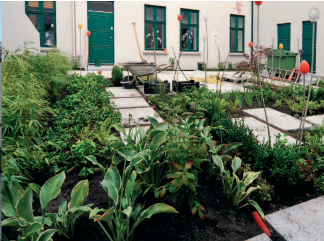
Bildene viser forvandling i gårdsrommene, Henrik Ibsensgate 10 og Torggata 9.