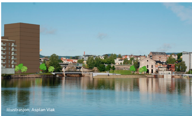
Illustrasjon: Asplan Viak