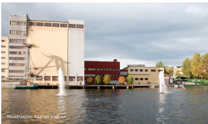
Illustrasjon: Asplan Viak