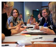
SAMARBEID PROSJEKTGRUPPE OG STYRINGSGRUPPE

Basert på innspillene i medvirkningsprosessen har det blitt utarbeidet forslag på tiltak som kan realiseres innenfor en midlertidig bruk av området, og som eventuelt kan videreføres i en endelig opparbeiding av området. En del tiltak allerede er satt i gang. Gjerdet rundt området er fjernet. To gang- og sykkelveger fra Lindemansgate til Fridtjof Nansens gate, langs begge sider av Idrettshallen, skal forbedres og få belysning. I tillegg jobbes det med å skape nye forbindelser fra Stevneplassen til Lundedalen og forbedre stien langs Falkumelva.