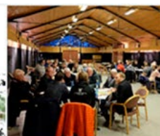
BEFOLKNINGSPANEL En digital forslagskasse med hvor 20 personer har gitt over hundre innspill, minner og forslag til midlertidige aktiviteter.