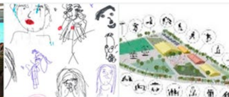
UNGDOMSWORKSHOP 14 ungdommer fra Skien Ungdomsråd og 5 fra elevrådet ved Mæla ungdomsskole.