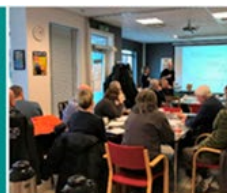
OPPSTARTSMØTE MED REFERANSEGRUPPE