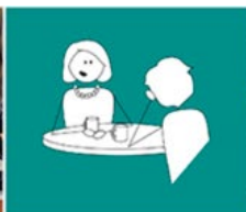
INTERVJUER OG OBSERVASJON