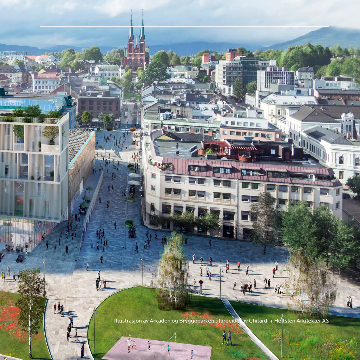
Illustrasjon av Arkaden og Bryggeparken utarbeidet av Ghilardi + Hellsten Arkitekter AS