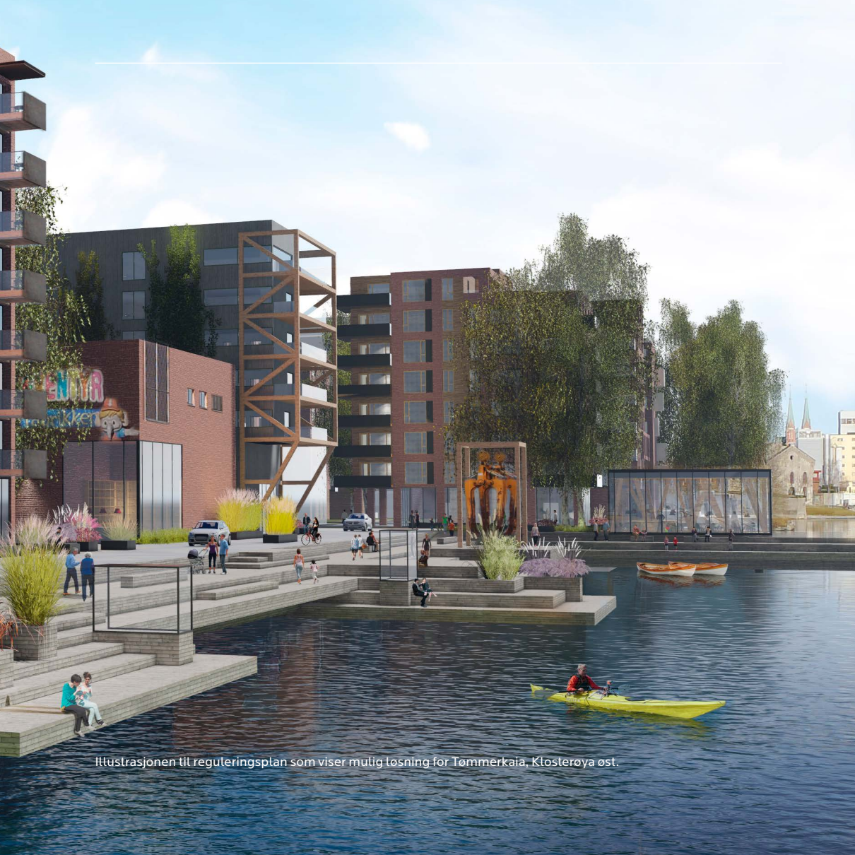
Illustrasjonen til reguleringsplan som viser mulig løsning for Tømmerkaia, Klosterøya øst.