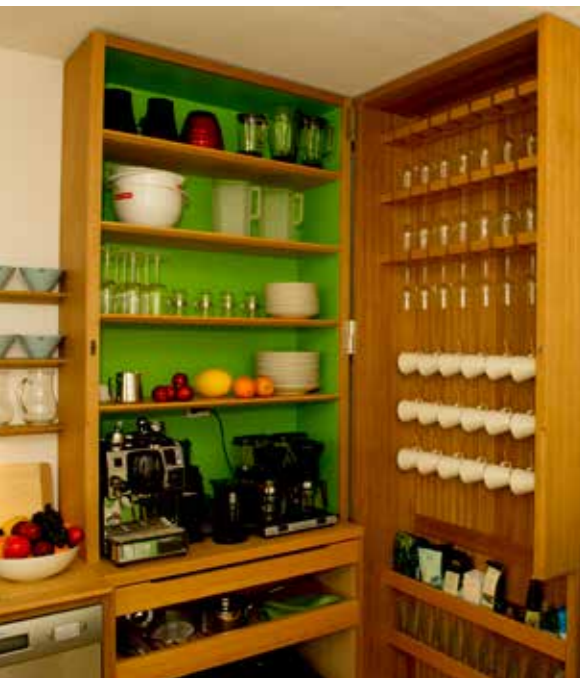
Fra Mersmakkontoret, Kjetil Harket