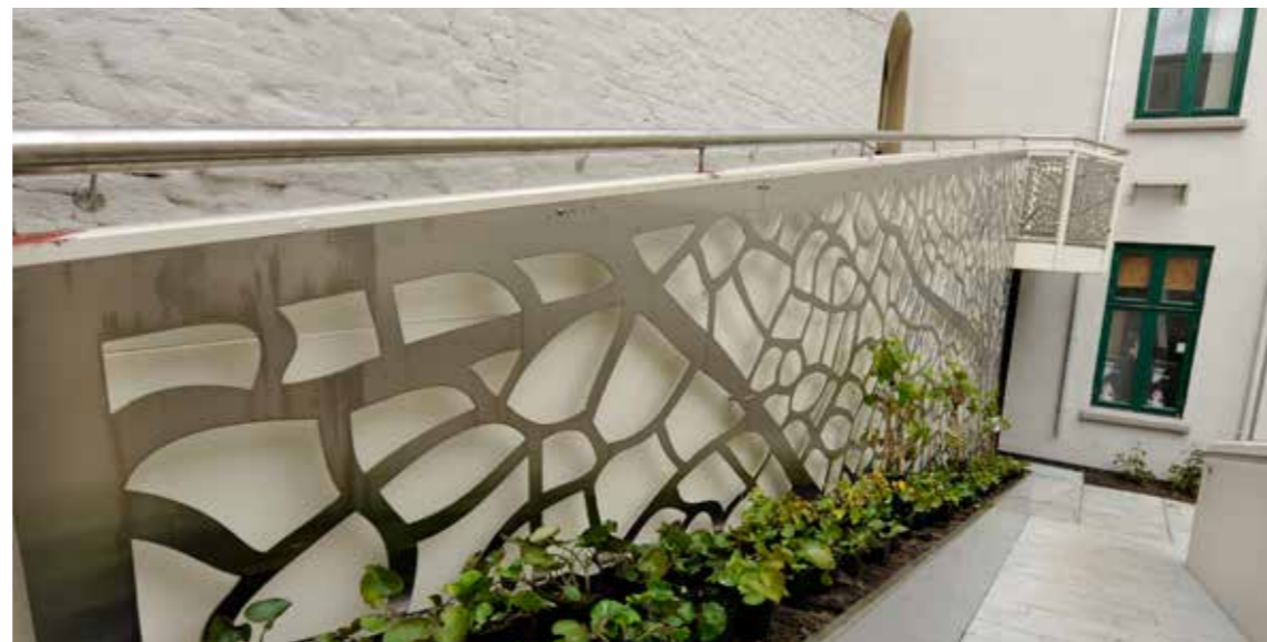
Vegg av Pernille Bache Design

Kunstnerne som bidrar i prosjektet er fortrinnsvis lokale. I den helhetlige byutviklingsplanen for Skien har kommunen valgt å se de ressursene som finnes innen rekkevidde og benytter hovedsakelig aktører med tilknytning til området. I tillegg til at hver enkelt innehar en unik